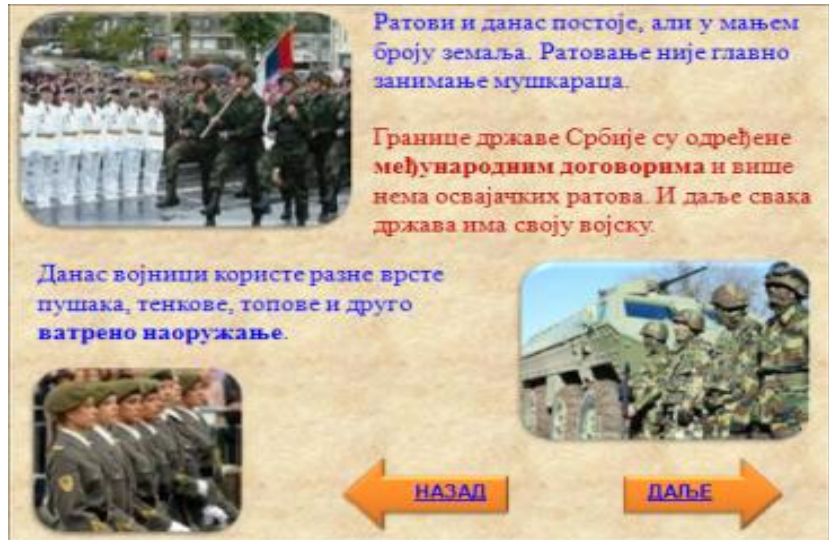
(Слика 6 и 7)

После сваке целине ученик се враћа на почетни слајд и бира друго поље.