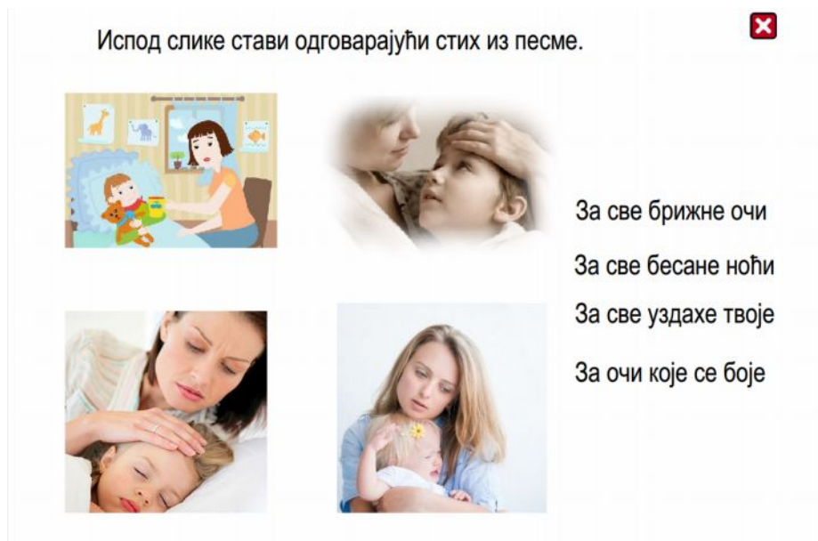
Слика 5. Детаљ из једног задатка

ће му дати повратну информацију. Уколико је ученик тачно урадио, притиском на дугме у горњем десном углу затвара овај електронски наставни листић и отвара следећи.