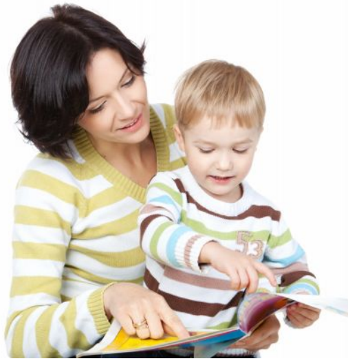
Слика 1. Детаљ из презентације

Ученици се налазе у дигиталном кабинету. Седе за рачунарима. Учитељ им објашњава да ставе слушалице на уши, пронађу у дељеним документима и покрену презентацију на којој ће бити представљене фотографије мајке и њеног детета. 1 Ученицима напоменути да ће се слајдови мењати аутоматски и да не користе миша и тастатуру. Презентација је пропраћена песмом Моја мама дивно прича , у извођењу хора „Колибри“. На овај начин код ученика ће бити ангажовано више чула. Уколико буду желели, могу се прикључити заједничком певању.