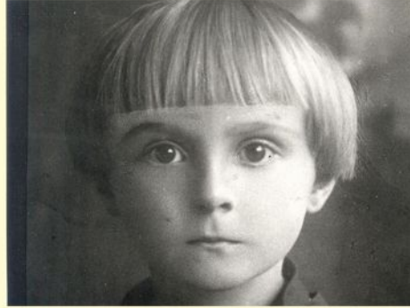
Слика 2. Детаљ из презентације о биографији Мире Алечковић